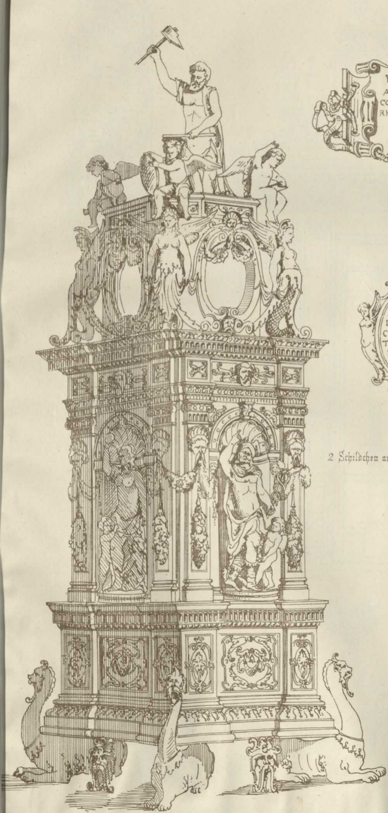
Ofen in dem Rathhaus zu Augsburg.

Veröffentlichung vom ARCHITEKTEN-VEREIN am Kgl. Polytechnikum in Stuttgart.