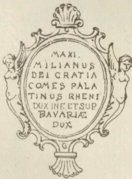
2 Schildchen auf den Kanonen vor dem Zeughaus in Augsburg.