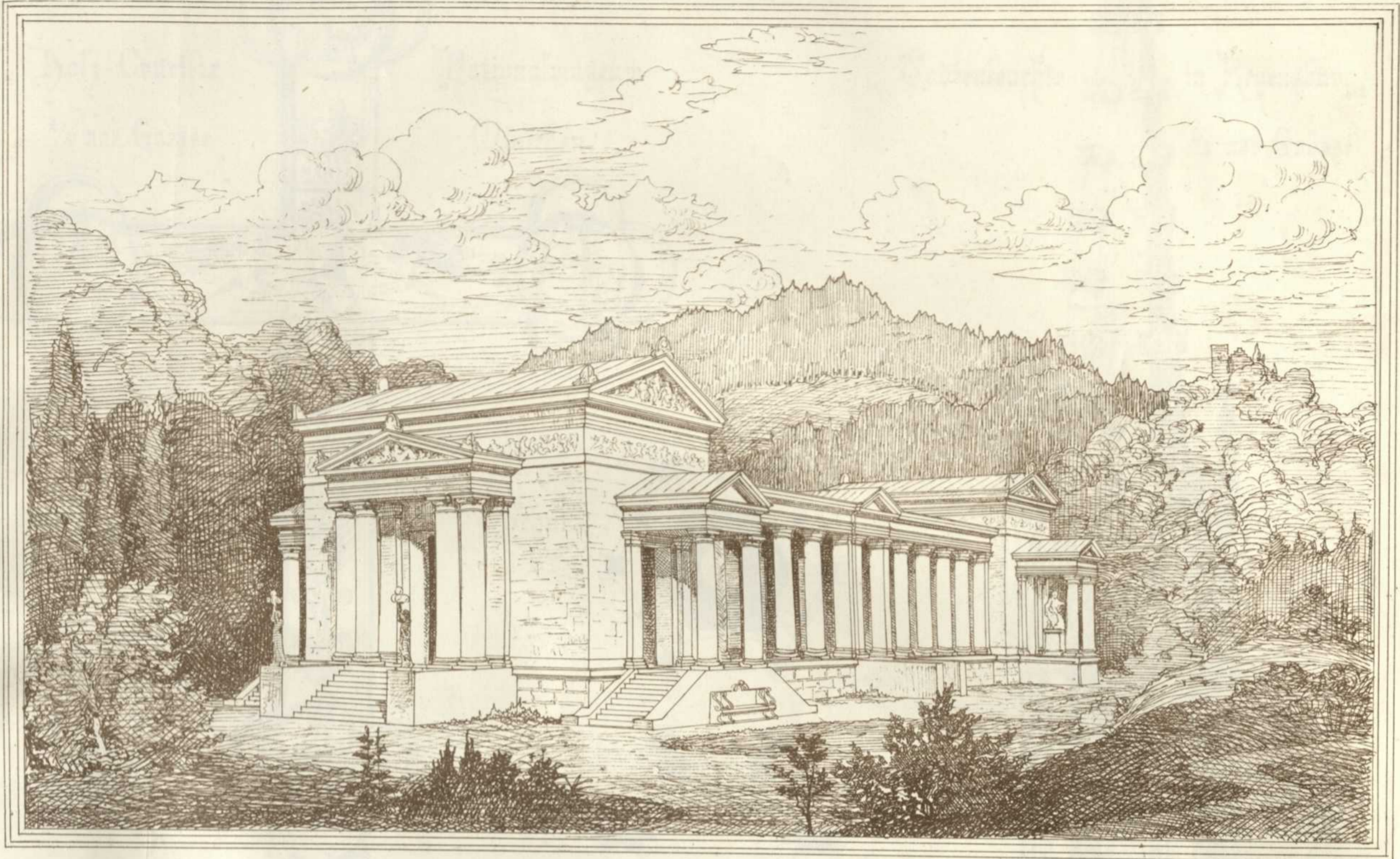
Ansicht der Quelle.