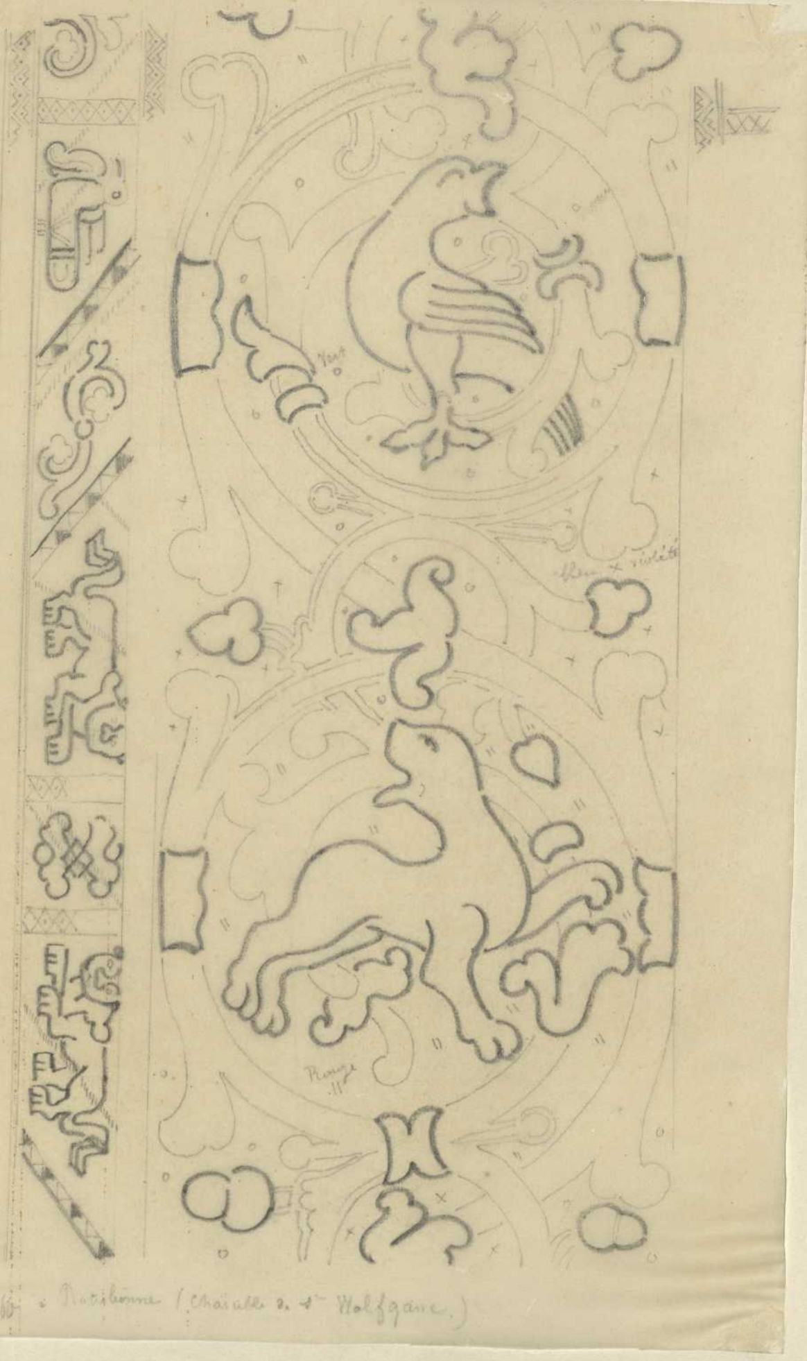
Stoffe - Natisbonne (Château de Wolfgang.)

Les Archaïques de la 2 me partie de l'art animal. Les figures ont souvent une forme animale.