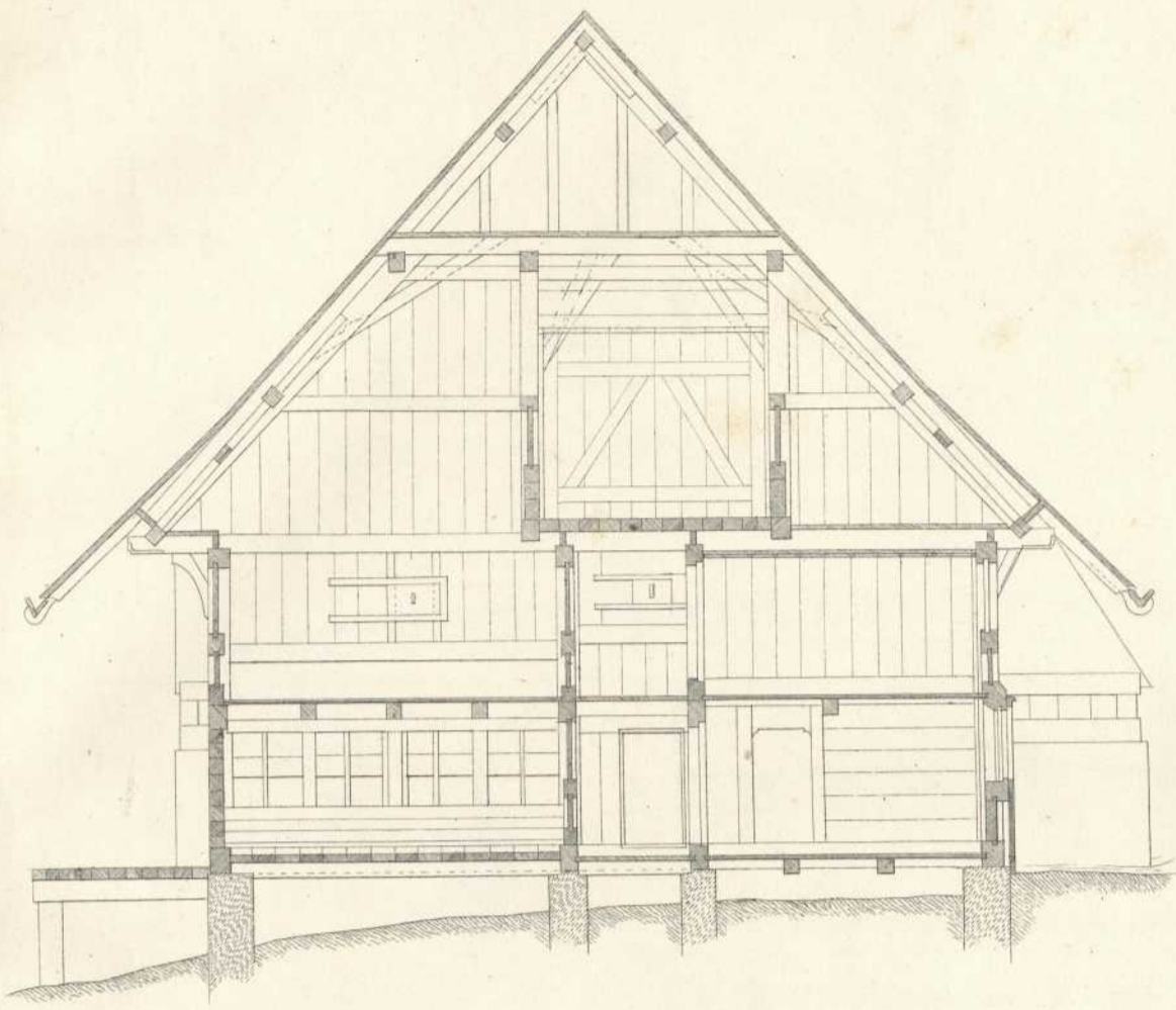
Querschnitt nach z z.