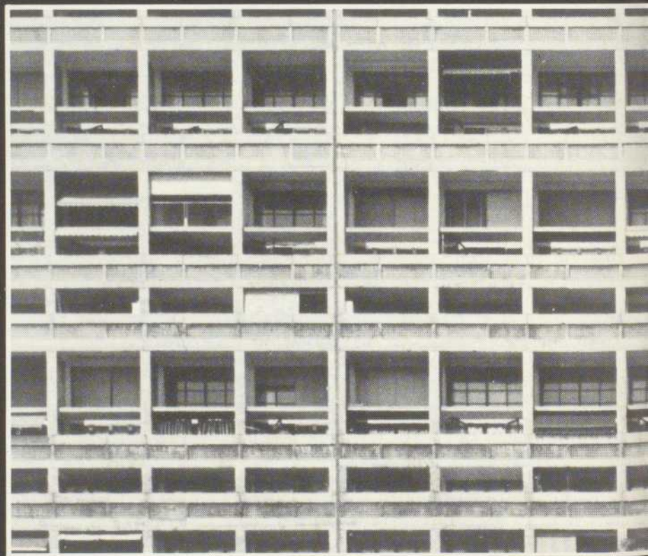
1947-52 Marseille - Boulevard Michelet Le Corbusier - Unité d'Habitation

Marie Antoinette, Königin von Frank- reich, erschien im Jahre 1785 einmal à la jardinière frisiert: mit einer Artischocke, einem Kohlkopf, einer Karotte und einem Bund Radieschen