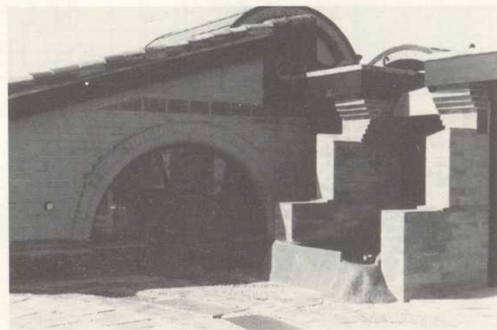
Eingangsbereich, hinter dem Fenster befindet sich das Architekturbüro.

Adresse: Centre de terre Lavalette 31590 Verfeil – Frankreich Tel.: 0033-(61)-847398