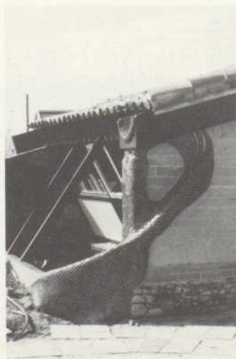
Originelle Wasserableitung und verspielte Ecke als grünes Glasmosaik. Das Wasser von verschiedenen Dächern wird in Auffangbecken vor den Fenstern gesammelt.