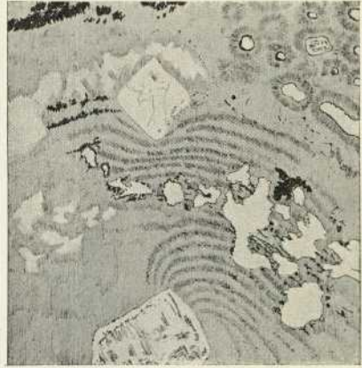
Abb. 2. 1:75.