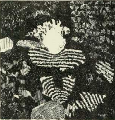
Abb. 3. 1:75.