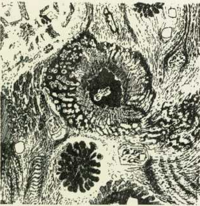
Abb. 8. 1:10.