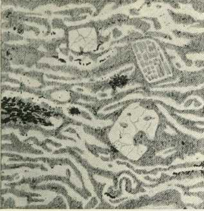
Abb. 5. 1:75.