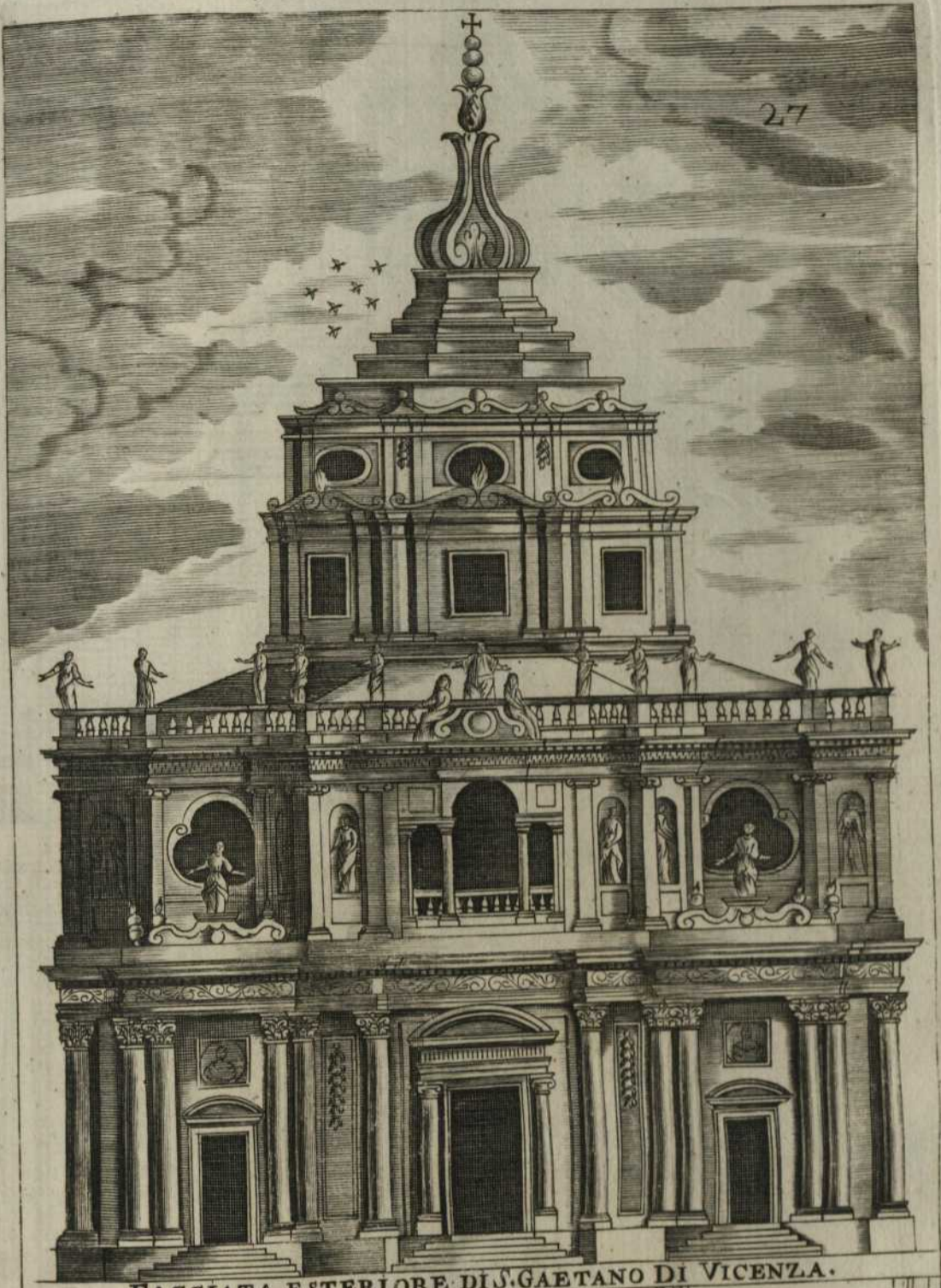
FACCIATA ESTERIORE DI S. GAETANO DI VICENZA.