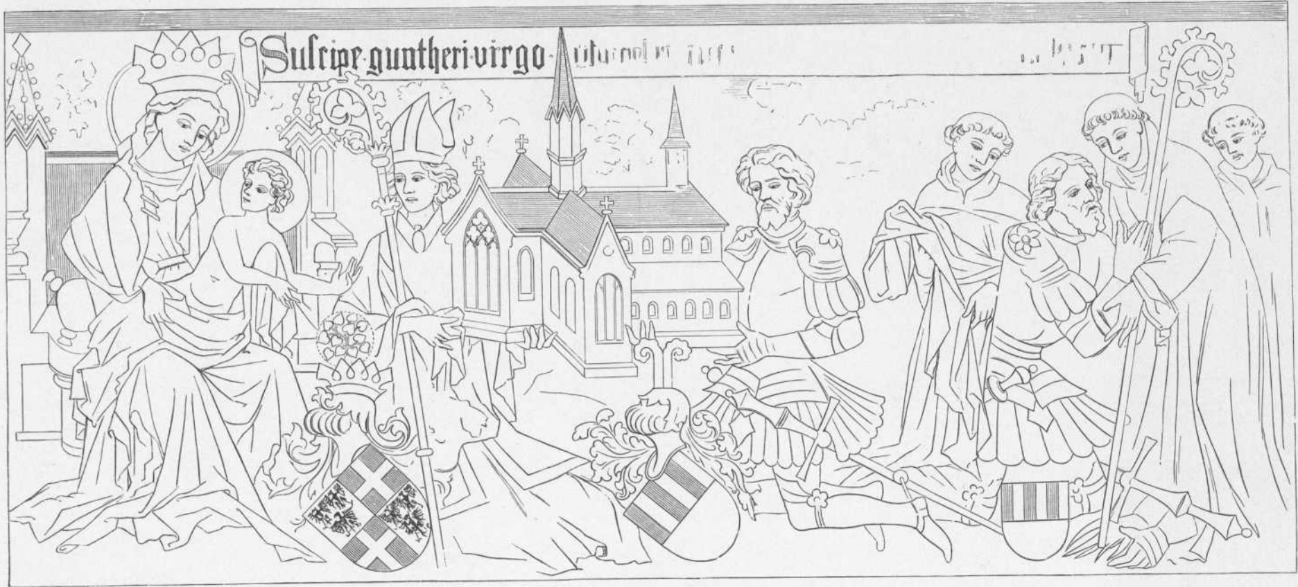
Wandgemälde aus dem Jahr 1424, die Stiftung des Klosters darstellend.