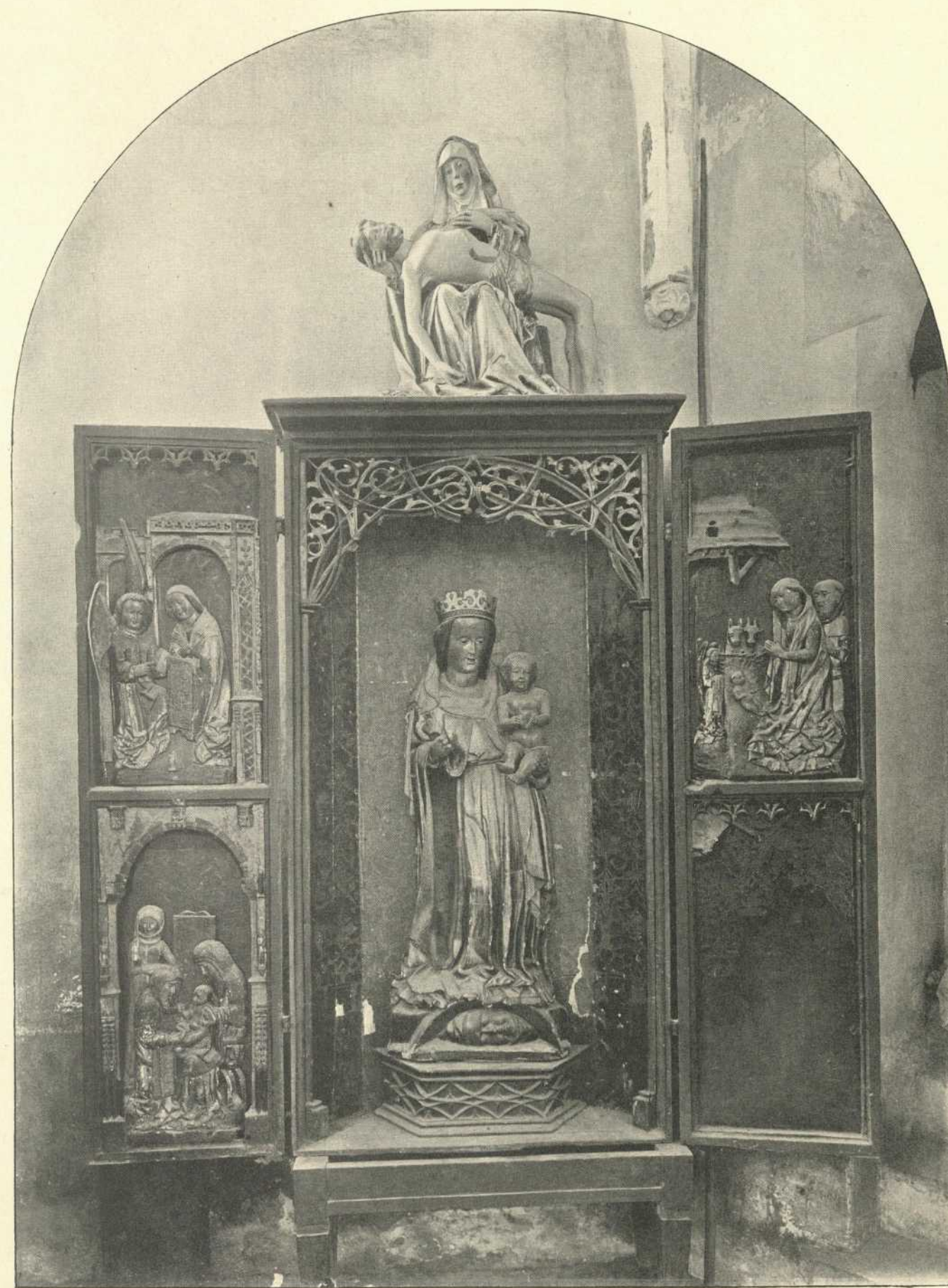
Altarschrein in der Kirche zu Westgartshausen.