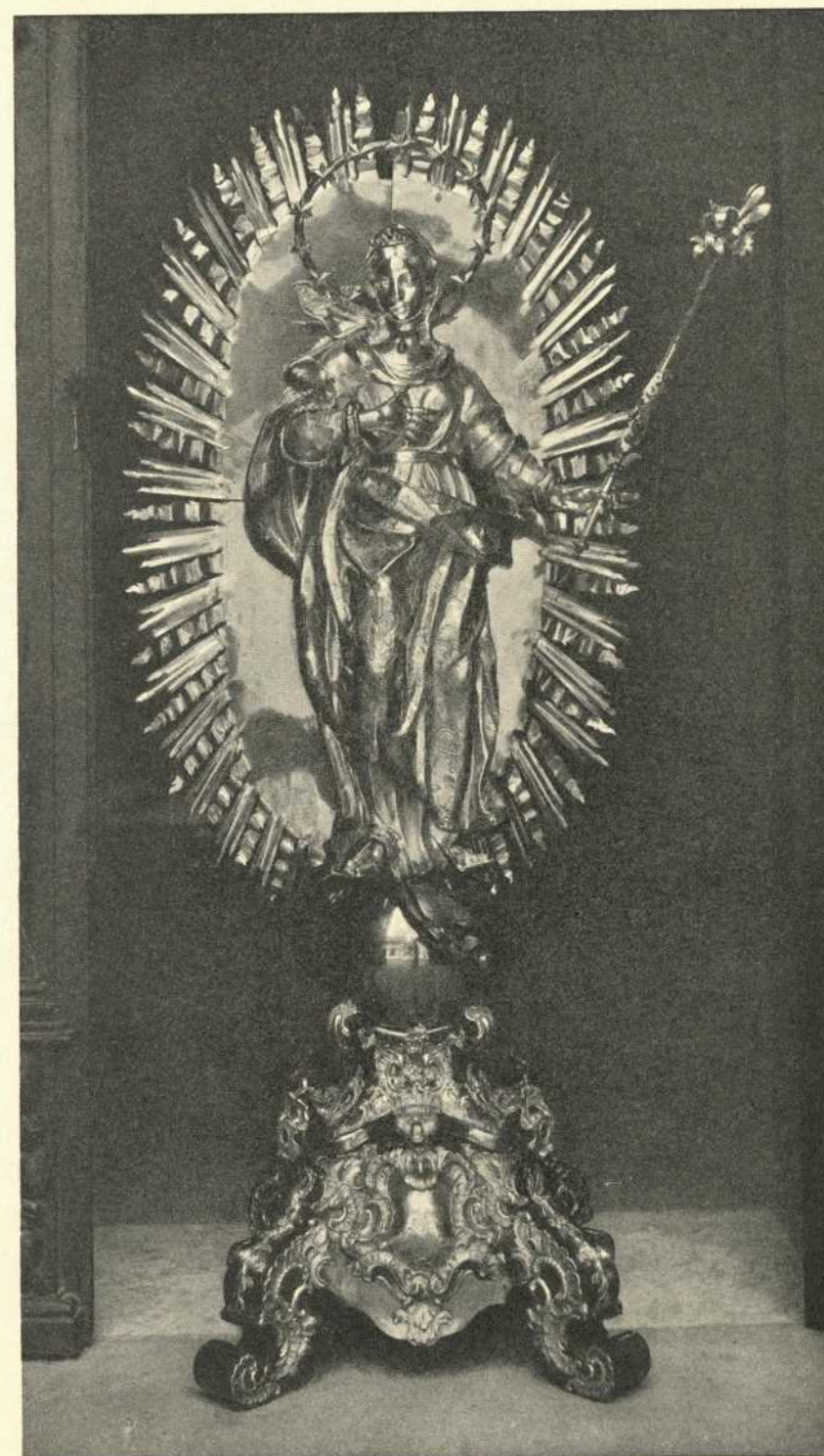
Madonnenstatue in Silber, 18. Jahrh.