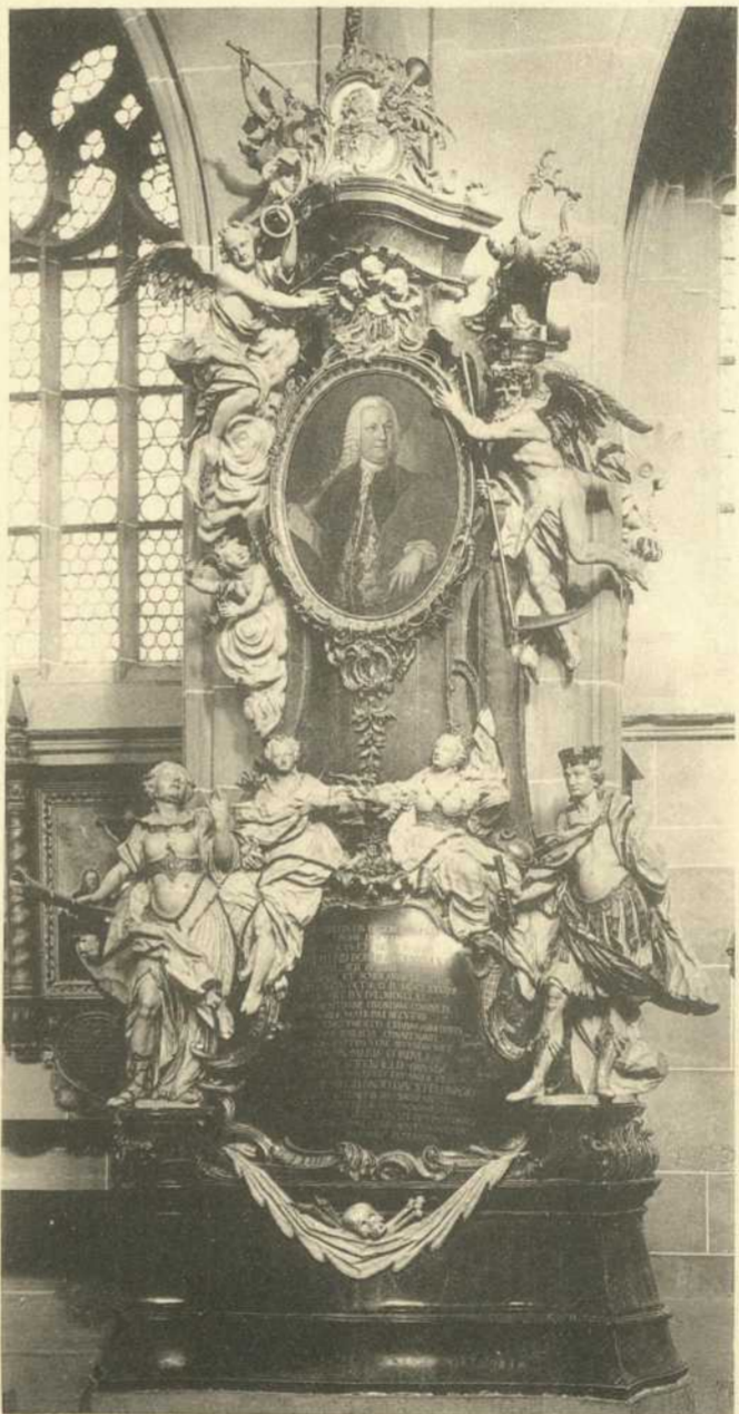
Lichtdruck von Eberhard Schreiber.