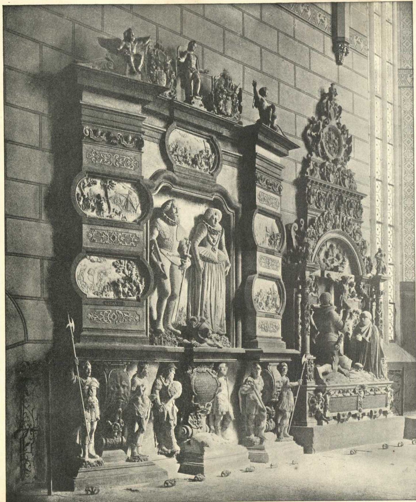
Grabdenkmäler an der Nordseite des Chors.

Graf Philipp v. Hohenlohe-Neuenstein. Graf Ludwig Casimir v. Hohenlohe-Neuenstein.