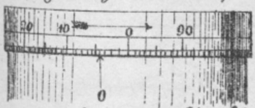
fig II Gehäusekopf

nimmal umgekehrt wird. Der Tefel der, der Tefel ist in 100 Teile sichtbar (1. fig) in. von Gefühlpumpe ist ein Markte 0 umgekehrt. Wenn die Markte 1 mit mit einem Kreis der Markte zu prüfen fällt, wie folgt bei G der Tefel der Tefelung auf der Markte 0 steht, so könnte man durch sichtbar der Tefelungspitze G mit dem Tefel E Lössungspumpe der Tefelung (verfügen von der Markte selbst jungen Teile abgeben, von sind, davon jeder = 100 zu setzen, wenn man einen Teil der Tefelungspumpe